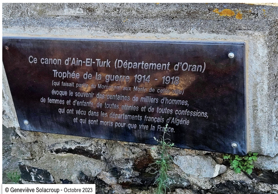
© Geneviève Solacroup - Octobre 2023