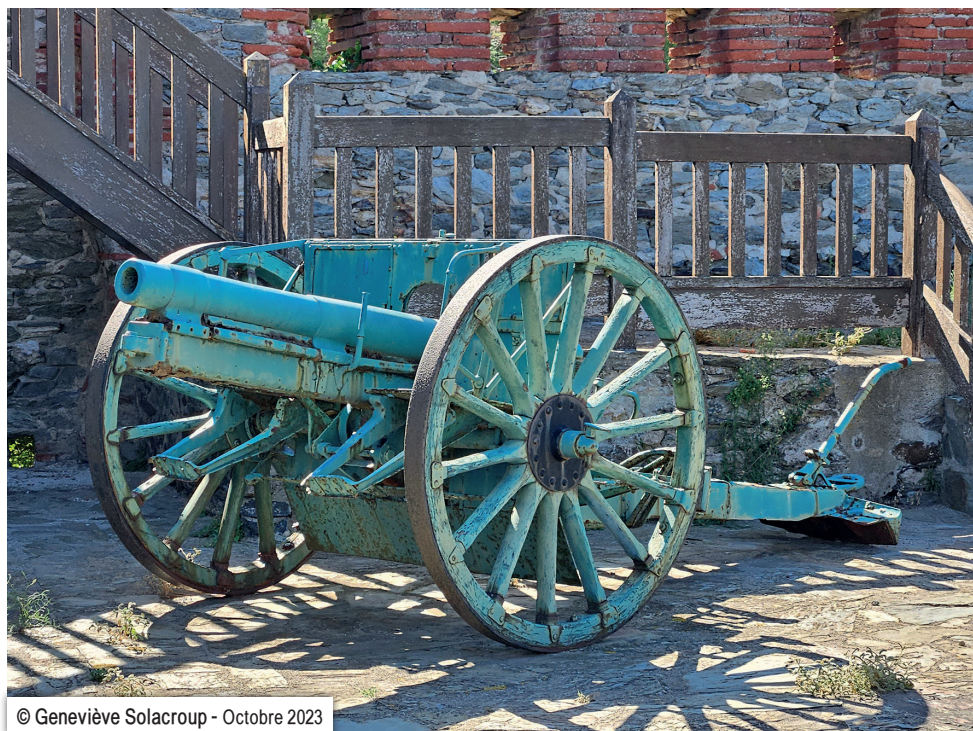
© Geneviève Solacroup - Octobre 2023